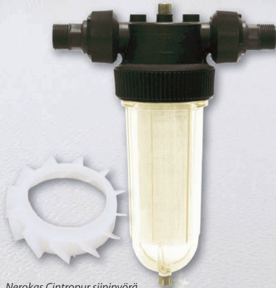
Nerokas Cintropur siipipyörä muuttaa veden virtauksen linkoavaksi